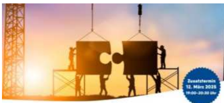
Ehrenamtliche Mitverantwortung in den Pastoralen Räumen

Ehrenamtliche Mitverantwortung in den Pastoralen Räumen Online-Forum zur Vorstellung des neuen Statuts für die pastoralen Gremien und Engagementformen im Erzbistum Paderborn Zusatztermin 12. März 2025 19:00-20:30 Uhr ZIELGRUPPE Das Online-Forum richtet sich an ehrenamtlich und hauptamtlich