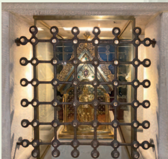
Schrein unter dem Altar des St. Patrokli Domes